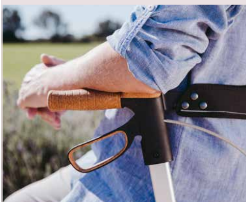
Armauflage aus Kork-TPE

Anti-Rutsch-Pads erleichtern das Ankippen des Rollators