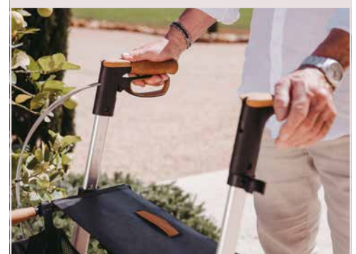
Umbaubar auf Einhand-Simultanbremse