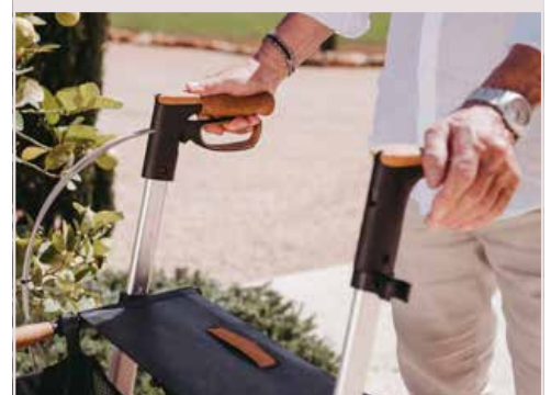
Umbaubar auf Einhand-Simultanbremse