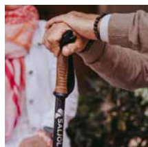
Carbon Gehstock 99,00 €