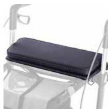
Fester Sitz 59,00 €