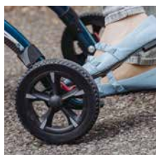
Schleifbremse 39,00 €