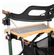
Holztablett mit Filzauflage 69,00 €