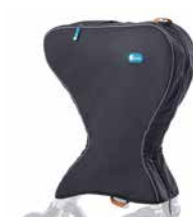
Transporttasche 89,00 €