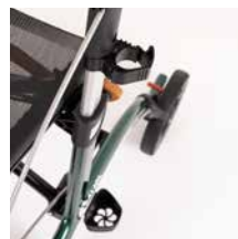
Stockhalter 19,00 €