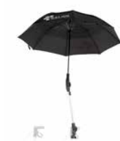
Schirm schwarz 89,00 €