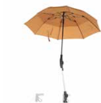
Schirm karamell 89,00 €