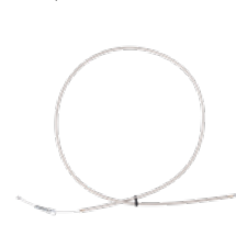
Bremskabel für den Umbau zur Einhandbremse 0,00 €