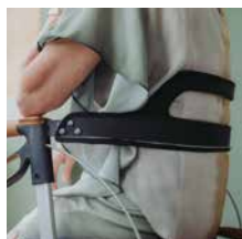
Rückengurt 49,00 €