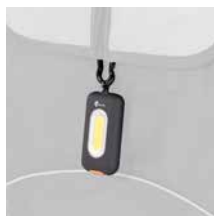
LED-Licht 10,00 €