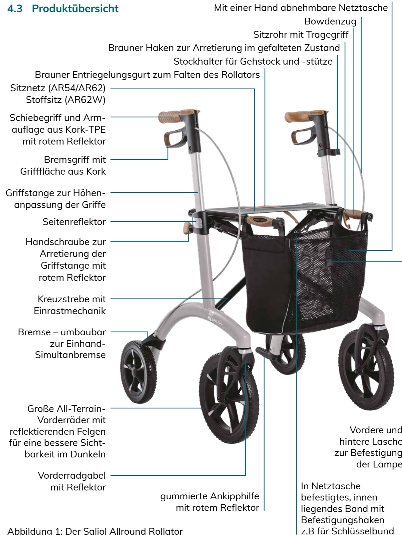
Abbildung 1: Der Saljol Allround Rollator (Rückengurt, Klingel und LED-Licht nicht abgebildet)