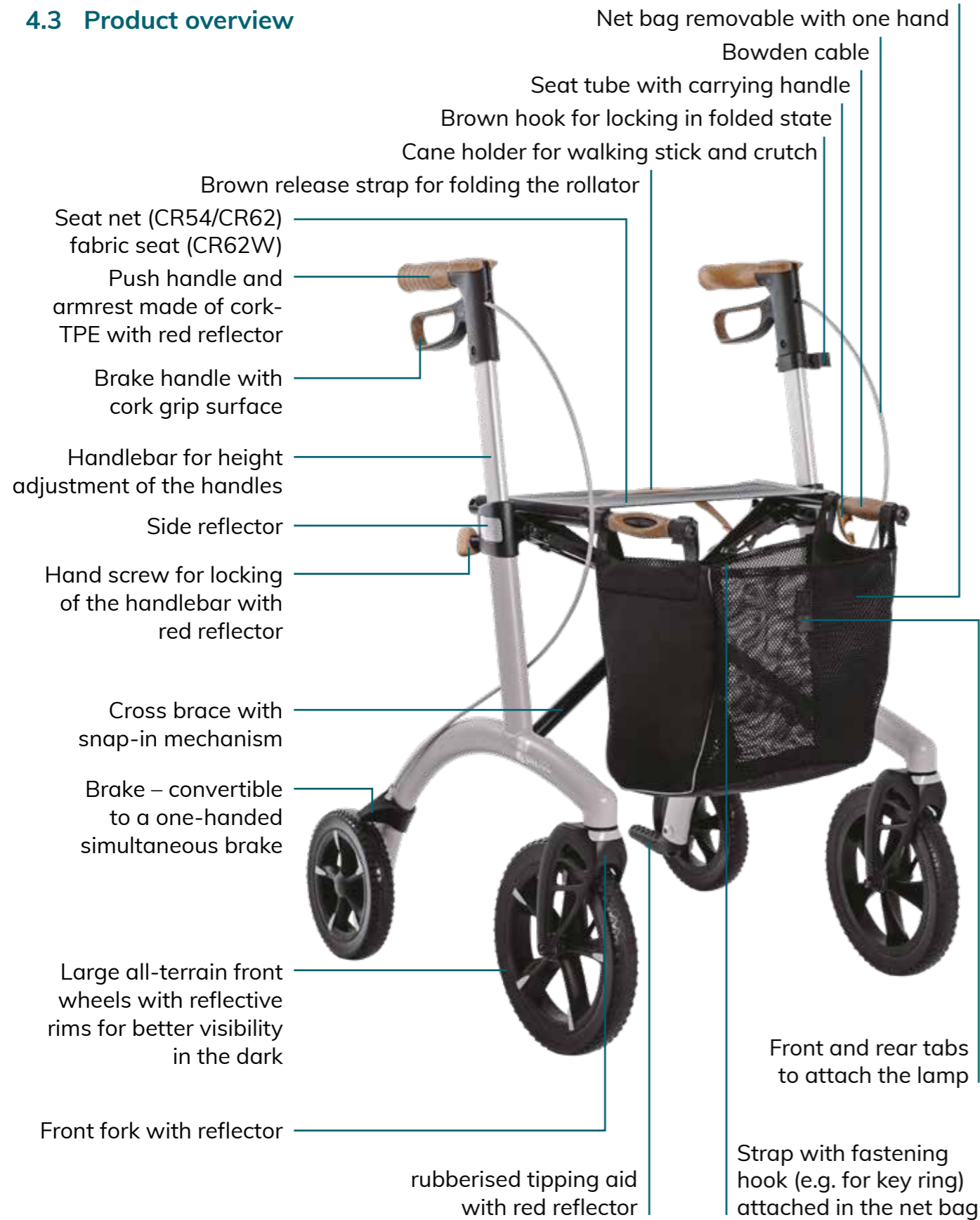
Figure 1: The Saljol Allround Rollator (back belt, bell und LED-light not shown)